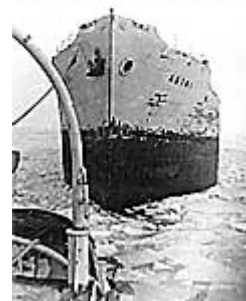
"Astri" før og etter nedrigging til lekter