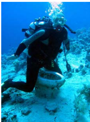
Evald har funnet seg et